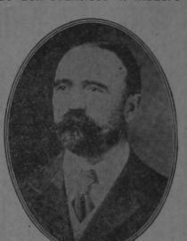
General don Francisco I. Madero

Todas las probabilidades estan de parte de don Francisco I. Madero