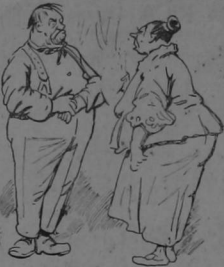
Hablas con un candidato a la Presidencia de la República

Las convicciones, los ideales, todo eso son pueruchas en que el pueblo no cree pues cada uno que sube, hace arriba lo contrario de lo que abajo prometió: para hacer un viajeito á Nicaragua y otro á Washington, no faltará algún amigo que sacará el metálico... etc etc. En cuanto á prometer, ya verán ustedes, ya verán: ramos de todos los candidatos baldíos y de los que lo serían después, que á promesa yo les daré cinco y raya; en mi programa quedará Cartago reconstruido, San José asfaltado, Heredia con un órgano que se oiga en Patagônia. Limón sin calor. Alajuela puerto de mar y Puntarenas balneario oficial. De cada partidario haré un empleado: de cada partidaria, si es bonita, haré lo que pueda, á los empujones los pondré á servir á los amigos y al que no ande, derecho lo fusilo. Respecto estaba mis planes, cuando entró mi mujer. «¿Qué te pasa que no has venido á acostarte?» «¿Que qué me pasa?» «¿Si?» «¿No sabes con quién hablas?» «Pues claro, con Ramiro, mi esposo.» «Estás equivocada: hablas con un candidato á la Presidencia de la República. Cast le dé un ataque. Hilo tal estrepito que toda la casa se puso en movimiento. Quando se repuso me dijo lanzándome una mirada terrosa: «-Y yo que te creía tanto!»