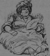
Una mujer muy frondosa

Las hijas bastante guapas, una de ellas sin novio Don Pánfilo; por que no he deseen candidato si en mí se conste y reusen las más salientes cualidades que hay en cada uno de ellos? Además de esas tengo otras prendas que conviene que no ignoren mis futuros partidarios: la dentadura sana, un excelente apérito, dos hijas bastante guapas, una de ellas sin novio, una mujer muy frondosa, un automóvil averiado y un buen humor á prueba de toda adversidad. En esas condiciones, ¿quién no lo elige? El dinero ya no hace falta: se lo saca á los empleados.