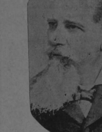
General don Bernardo Reyes

He aquí los retratos de los dos candidatos a la Presidencia de la República de México. Uno de ellos, el señor Madero, es el caudillo de la falange democrática. El otro, el General don Bernardo Reyes, es el caudillo del Ejército contra el cual gana de inmenso prestigio y a su lado se han repliegado excelentes elementos de la clase media y de los altos políticos que se opusieron al grupo de los científicos que rodeaba al General Díaz. Mañana sabremos cual de los dos será electo Presidente.